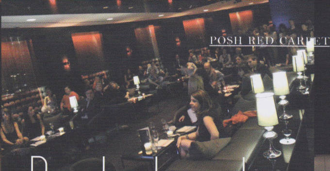
POSH RED CARPET